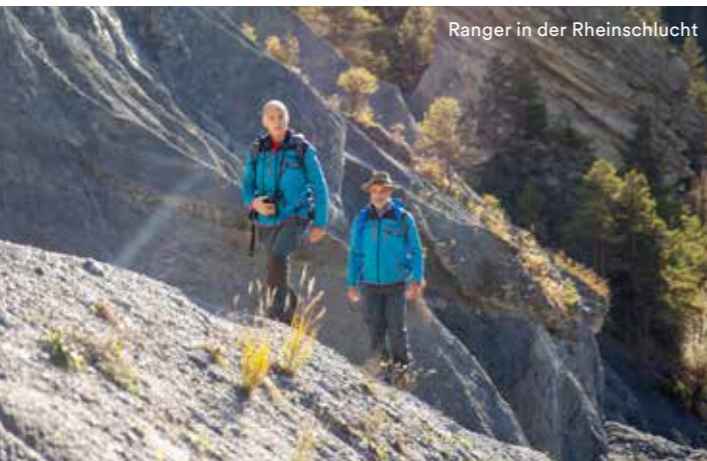
Ranger in der Rheinschlucht

Natur- und landschaftsverträgliche Erlebnisse in der Rheinschlucht setzen eine Besucherlenkung voraus. In Kooperation mit dem Naturpark Beverin und der Tektonikarena Sardona hat der Verein Rheinschlucht einen Rangerdienst aufgebaut, welcher die umfassende Umsetzung der Besucherlenkung garantiert.