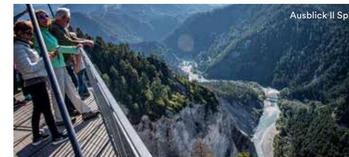
Ausblick Il Spir

Lassen Sie Ihren Blick schweifen und bestaunen Sie die Rheinschlucht aus der Vogelperspektive. Die Aussichtsplattform «Il Spir» ist eine von sieben besonderen Ausblick-Erlebnissen, die auf Wanderwegen erreichbar ist. Alle Aussichtsplattformen sind auf rheinschlucht.ch beschrieben und auf der Karte gekennzeichnet.