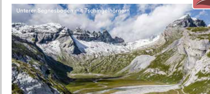
Unterer Segnesboden mit Tschingelhörnern