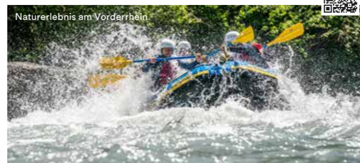
Naturerlebnis am Vorderrhein

Ein mitreissendes Erlebnis: Mit der Strömung von Ilanz nach Reichenau paddeln – eine faszinierende Strecke für Kanus, Kajaks und Riverrafting. Zwischen Ilanz und Reichenau gibt es diverse Ein- und Ausbootstellen sowie markierte Rastplätze (siehe Karte). Bitte berücksichtigen Sie die Verhaltensregeln in der Rheinschlucht, zu Gunsten unserer Natur.