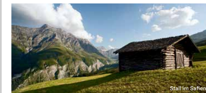
Stall im Safiental